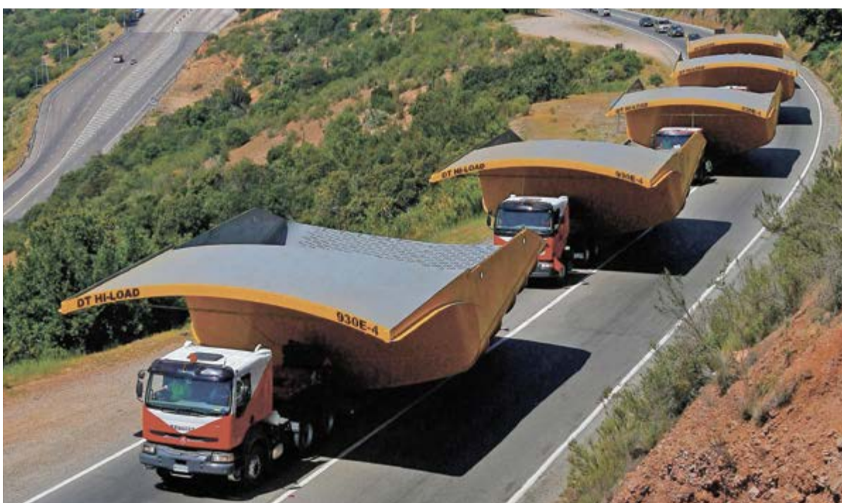
► La logística minera abarca procesos sumamente complejos.

Un buen manejo logístico en una operación minera reduce los costos de producción e incrementa la rentabilidad.